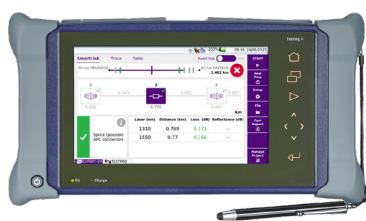
テスト実施および レポート作成