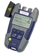
Fuente de luz óptica