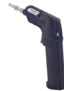
Sonda de inspección

¿Tiene un OTDR de VIAVI (JDSU)? Solicite una licencia de prueba gratuita de 30 días para FiberCable-SLM: tac@viavisolutions.com